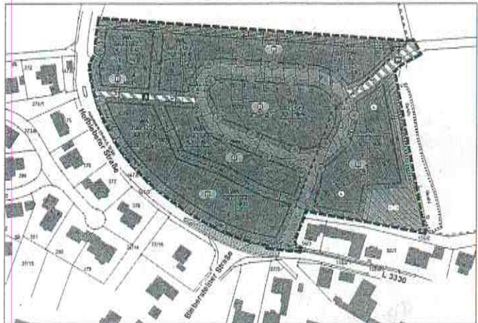
Abbildung: Geltungsbereich des Bebauungsplanes Nr. 26 „Speckacker“ (unmaßstäblich, genordet)

Der Geltungsbereich des Bebauungsplanes liegt am nördlichen Ortsrand von Langenbieber, er hat eine Größe von ca. 2,7 ha. Der Geltung umfasst in der Gemarkung Langenbieber, Flur 9, die Flurstücke 39/9, 39/14, 39/15, 39/16, 39/17, 39/18, 39/19, 39/20, 39/21, 40/2, 40/3, 57/1 (alle komplett) sowie die Flurstücke 56/3 (teils), 154/3 (Weg, teils) und 158/20 (Gehweg, teils). Die Abgrenzung des räumlichen Geltungsbereiches des Bebauungsplanes ist auf der nachfolgenden Abbildung dargestellt.